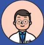
사전점검솔루션 후기 (M 산부인과)

갑작스러운 직원의 퇴사로 청구가 밀려 알아보다가 알려주신 내용과 더불어 사전점검프로그램을 이용하니 따로 더 신경쓸것 없어 아주 좋습니다. 고맙습니다 Rx+.