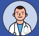
사전점검 솔루션 후기 (H 이비인후과)

개원준비 하면서 주변 지인들에게 물어보면 하나같이 Rx+ 사용하면 청구는 해결된다고 하길래 썼구요. 괜히 추천하는게 아니더라고요. 덕분에 한번도 삭감걱정을 해본적이 없네요.