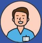
사전점검 솔루션 후기 (S 정형외과)

고시가 바뀐 줄 모르고 청구했다가 150만원 가량 조정되어 막막하던 중 Rx+ 프로그램을 알게 됐고 덕분에 이의신청도 쉽게 하고, 다음달 조정금액이 10만원도 안돼 쓰길 잘했다고 생각합니다.